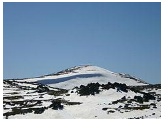
Góra Kościuszki -Australia

Kościuszeko - po dwustu latach a działał tak wiele, Połączył narody - na bankiecie i w Kościele. Żaden człowiek - nie ma tyle pomników na świecie, W każdym zakątku świata ślad Kościuszki znajdziecie. Świadczy to o „Wielkim Człowieku,” Którego świat pamięta od wieków.